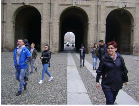
Parma - XVI wieczny PalazzodellaPilotta