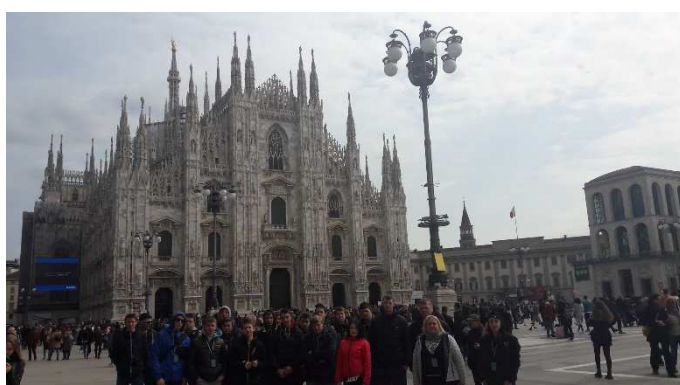
Katedra Narodzin św. Marii w Mediolanie