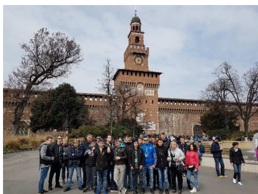
Zamek Sforzów w Mediolanie